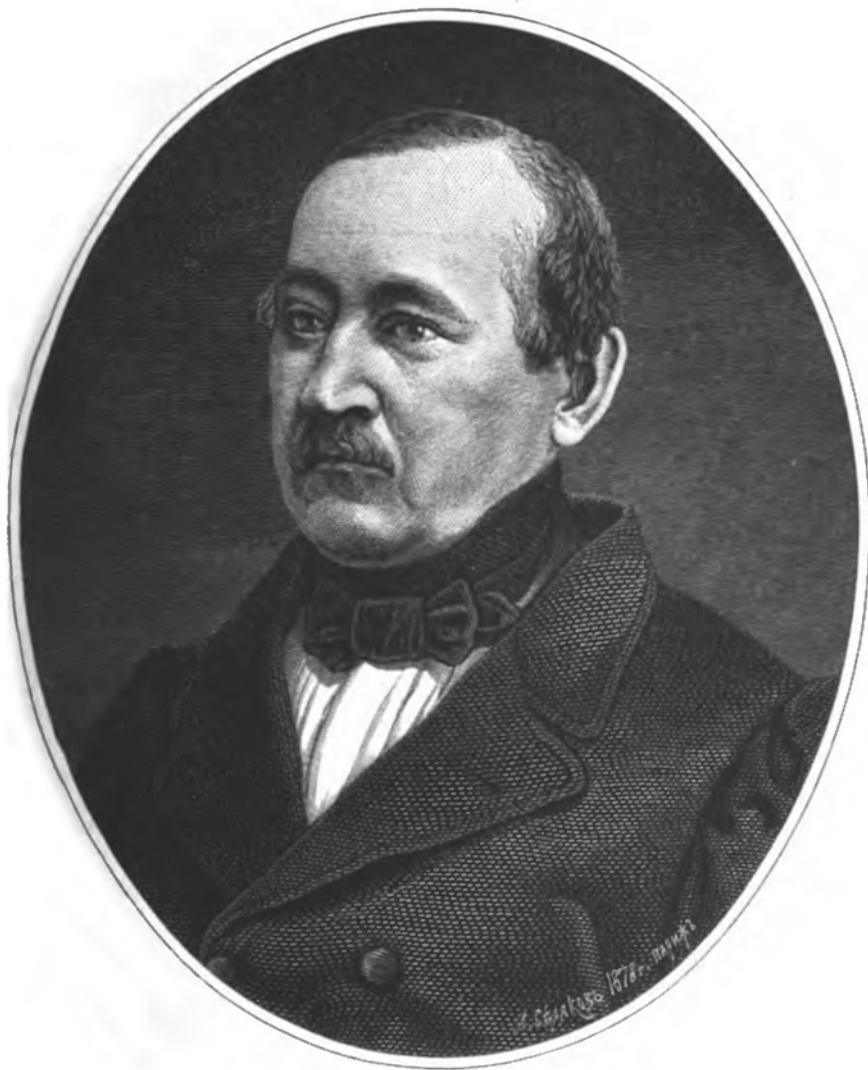
ОСИПЪ МАКСИМОВИЧЪ БОДЯНСКІЙ, ПРОФЕССОРЪ МОСКОВСКАГО УНИВЕРСИТЕТА. род. 1808 † 1876.